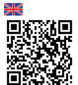
Video Blade exchange