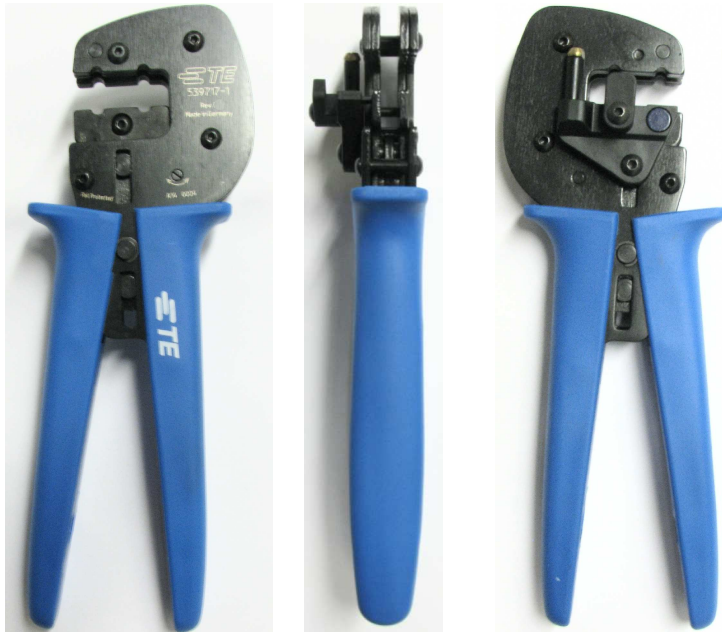
FRONT VIEW SIDE VIEW BACK VIEW