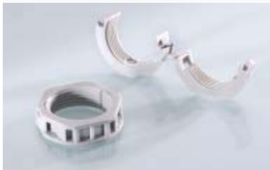
Abb. 1 Fig. 1