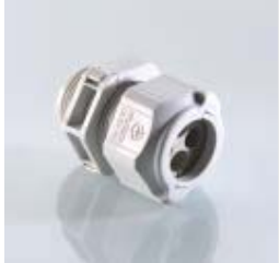
Abb. 1 Fig. 1

UNI Split Gland® – Splittable gland body