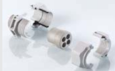
Abb. 2 Fig. 2